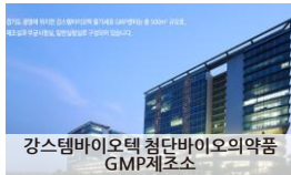
강스텍바이오텍 첨단바이오의약품 GMP제조소