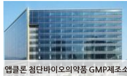
애플론 첨단바이오의약품 GMP제조소