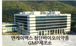
엔케이맥스 첨단바이오의약품 GMP제조소