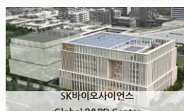
SK바이오사이언스 Global R&D Center