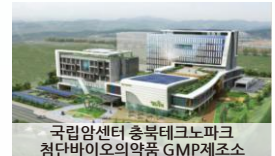
국립암센터 충북테크노파크 첨단바이오의약품 GMP제조소