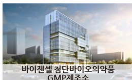
바이셀젠 첨단바이오의약품 GMP제조소