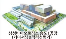
삼성바이오로직스 송도1공장 (커미서닝&적격성평가)