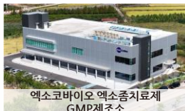
엑소코바이오 엑소줄지료제 GMP제조소