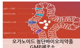
오가노이드 첨단바이오의약품 GMP제조소