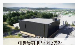
대한뉴팜 향남 제2공장