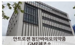
안트로젠 첨단바이오의약품 GMP제조소