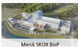
Merck SKOR BioP