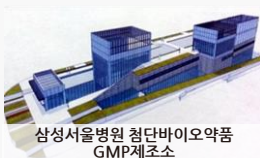
삼성서울병원 첨단바이오약품 GMP제조소