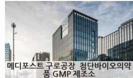
메디포스트 구로공장 첨단바이오의약품 GMP 제조소