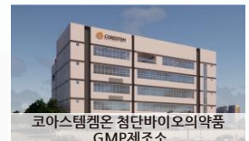
코아스템켄온 첨단바이오의약품 GMP제조소