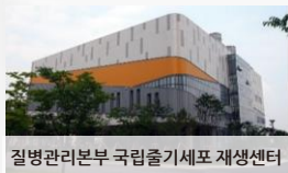
질병관리본부 국립질기세포 재생센터