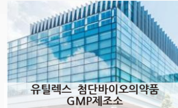
유틸렉스 첨단바이오의약품 GMP제조소