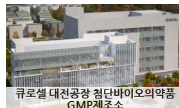
큐로셀 대전공장 첨단바이오의약품 GMP제조소