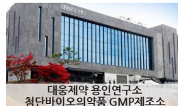
대웅제약 용인연구소 첨단바이오의약품 GMP제조소