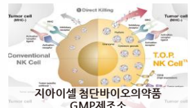
지아이셀 첨단바이오의약품 GMP제조소